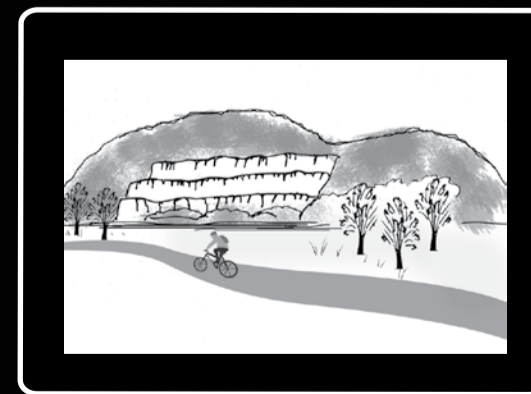
Une carrière de pierre bien visible gruge le flan d'une montagne.

Une initiative de : Table des paysages Bas-Saint-Laurent