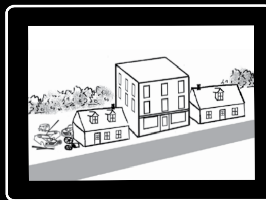
Immeuble de trois étages entre deux maisons patrimoniales; cours d'entreposage et ferraille.