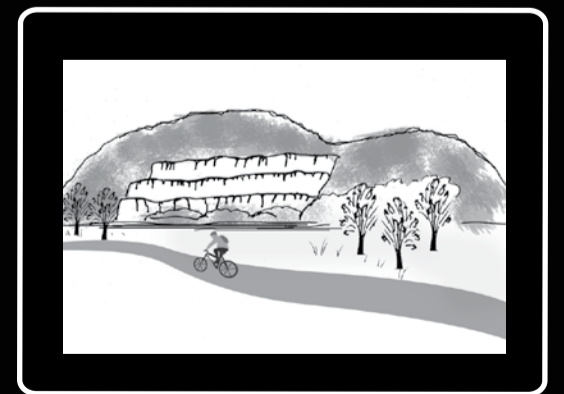
Une carrière de pierre bien visible gruge le flan d'une montagne.