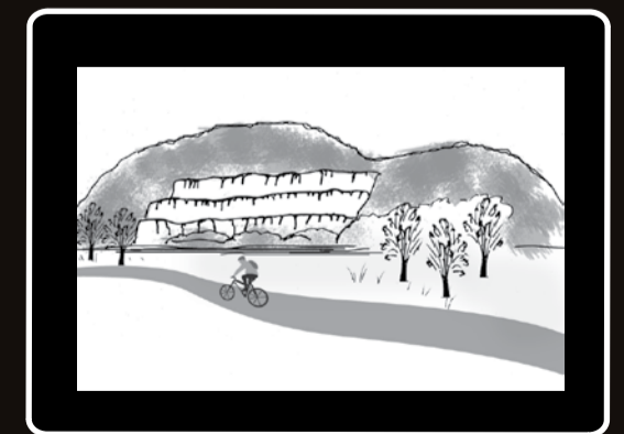
Une carrière de pierre bien visible gruge le flan d'une montagne.